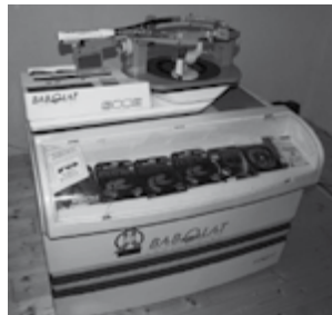
Professionelle Besaitungs- maschine BABOLAT 3002